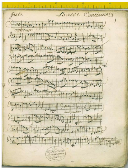
Abbildung 1. Zur Analyse von Notenhandschriften hat die Rostocker Universitätsbibliothek ungefähr 20.000 Notenblätter aus dem 17. und 18. Jahrhundert zur Verfügung gestellt.

Das interdisziplinäre Projekt „eNoteHistory“ versucht diesen Anforderungen gerecht zu werden. Hier werden Anwendungen mit Hilfe von Datenbanken für eine auf den Inhalt basierende Recherche in historischen Notenhandschriften entworfen. Kern dieses Projektes ist die Entwicklung von Indizierungs- und Retrieval-Techniken für verschiedenste Datentypen wie beispielsweise Texte und Bilder. Drei Forschungsgruppen kooperieren in diesem von der DFG geförderten Projekt: der Lehrstuhl für Datenbank- und Informationssysteme an der Universität Rostock, das Institut für Graphische Datenverarbeitung (IGD) sowie das Institut für Musikwissenschaft der Universität Rostock.